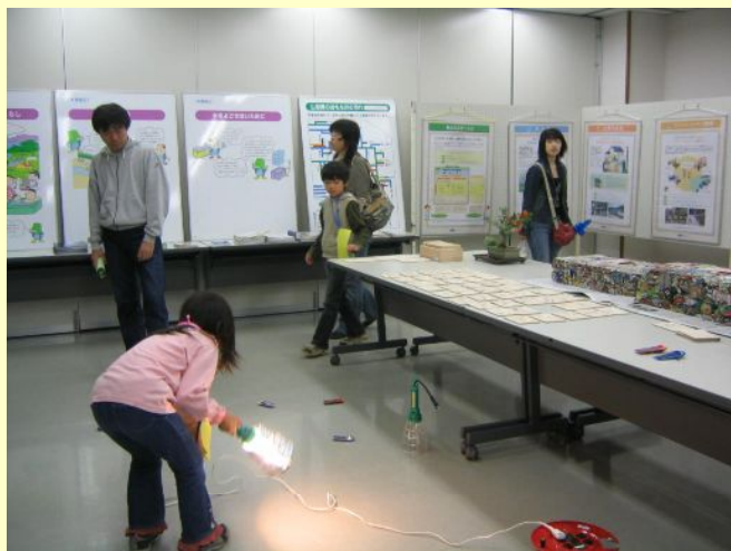
電気で豆ソーラーカーを動かしています。

これを機に、今後ますます地区内活動においてマナビストの力を結集していければと思います。