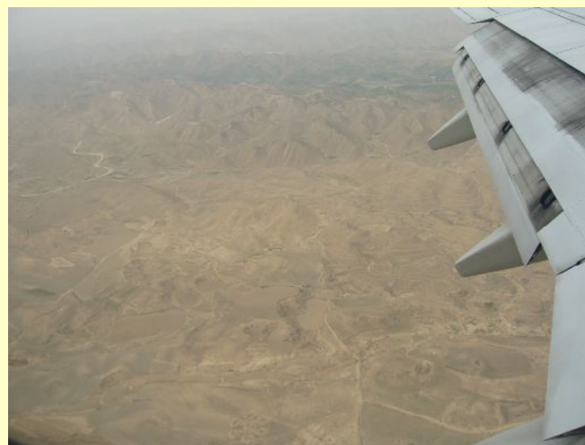
飛行機の中から 砂漠地帯を見る

「外務省 ODA 民間モニター」に4回挑戦して、今年やっと当選しました。山形県からは一人でした。6カ国のうち中国班に配属され、7月下旬の8日間、現地を見てきました。シリーズで見たままをお伝えします。ご意見ご感想をどうぞ。